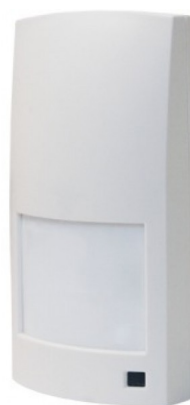
Photo(s) non contractuelle(s) Les caractéristiques du produit peuvent être amenées à différer légèrement du produit présenté.

Ref. PROMASK-DT25 Double Technologie IR+HF Antimasque 25m